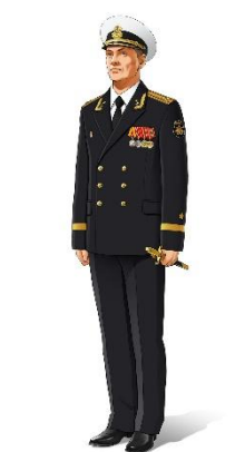
Форма №3 – летняя парадная форма одежды для строев